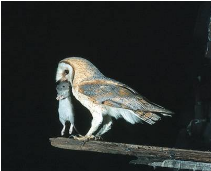
Schleiereule mit erbeuteter Maus.

Die Sterblichkeit der Schleiereule ist recht hoch, im ersten Jahr bis zu 64%! Nahrungseingänge, Giftbelastung durch Pestizide in den Mäusen und Straßenverkehr sind häufige Ursachen. Aber auch nicht abgedeckte Regentonnen und hoch stehende Rohre können tödliche Fallen darstellen. Daneben ist jedoch das Hauptproblem der Verlust an Brutplätzen. Modernisierte Kirchen mit Vergitterungen, Abbruch von Ruinen oder Restaurierungen alter Gebäude minimieren die Nistmöglichkeiten.